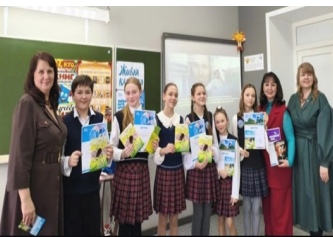
«Живая классика — 2026»