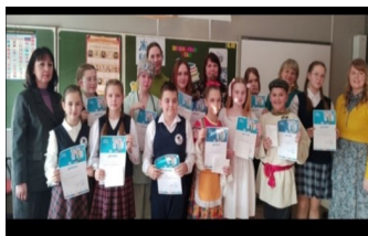
«Живая классика — 2025»